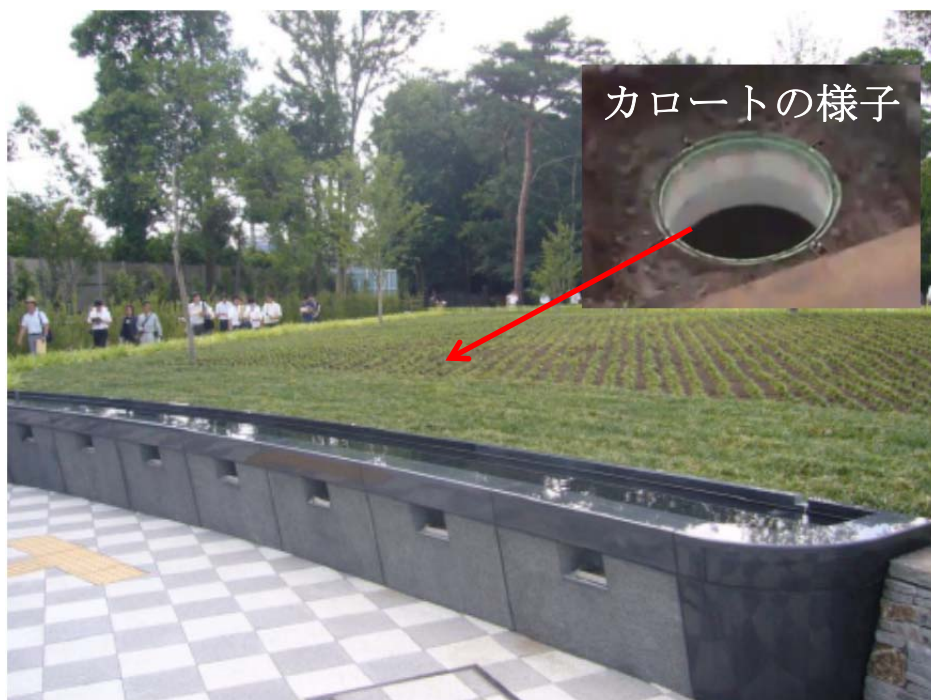
都立小平霊園 樹林墓地の様子